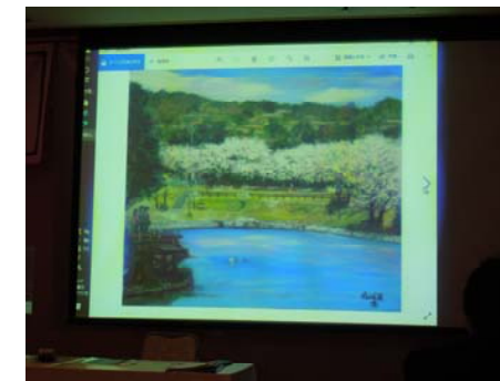
以上、一部抜粋にて紹介